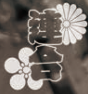
写真: 妙似灯 地車「正百土呂草 / 戦々島の戦い」加藤正 山形博賢の一場打ら」